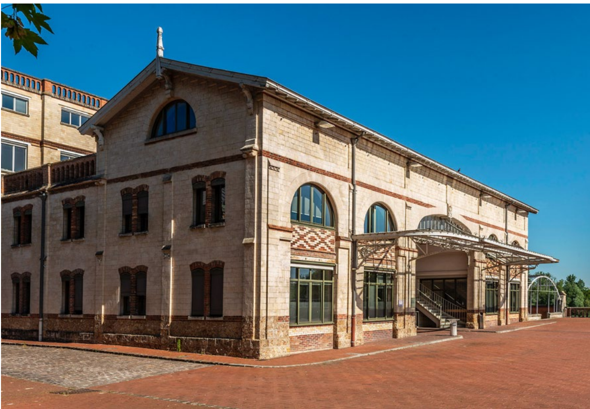
Bâtiment Patio, futur troisième campus de la Luxury Hotelschool